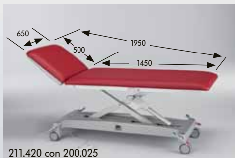
211.420 con 200.025